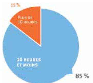
Nombre de trajets en fonction de leur durée