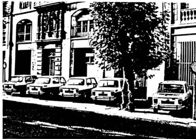
Fig. 5. Voitures Procotip sur un parc de stationnement réservé en centre ville